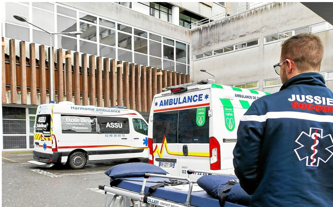
Un ambulancier sur le parking des urgences au CHU de la Cavale Blanche à Brest.